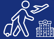
Grup Kişisel Kaza ve Seyahat